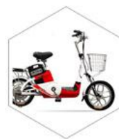
「 电动车报警器 」