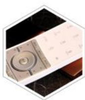
「 遥控器 」