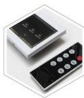
「 遥控开关 」