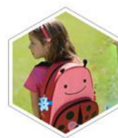
「 无线防丢器 」