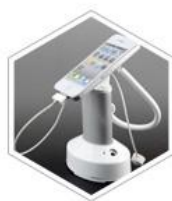
「 防盗报警器 」