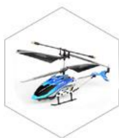
「 遥控玩具 」