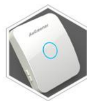
「 遥控开关 」