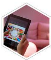
「 遥控灯具 」